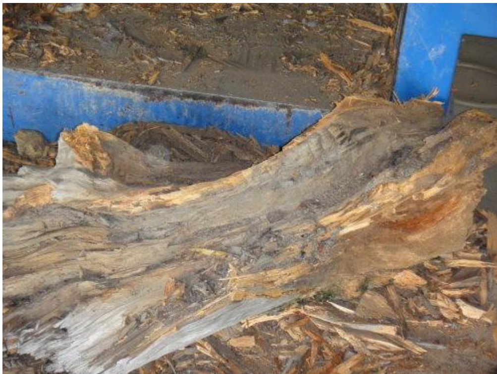
上了斷頭台的後果。