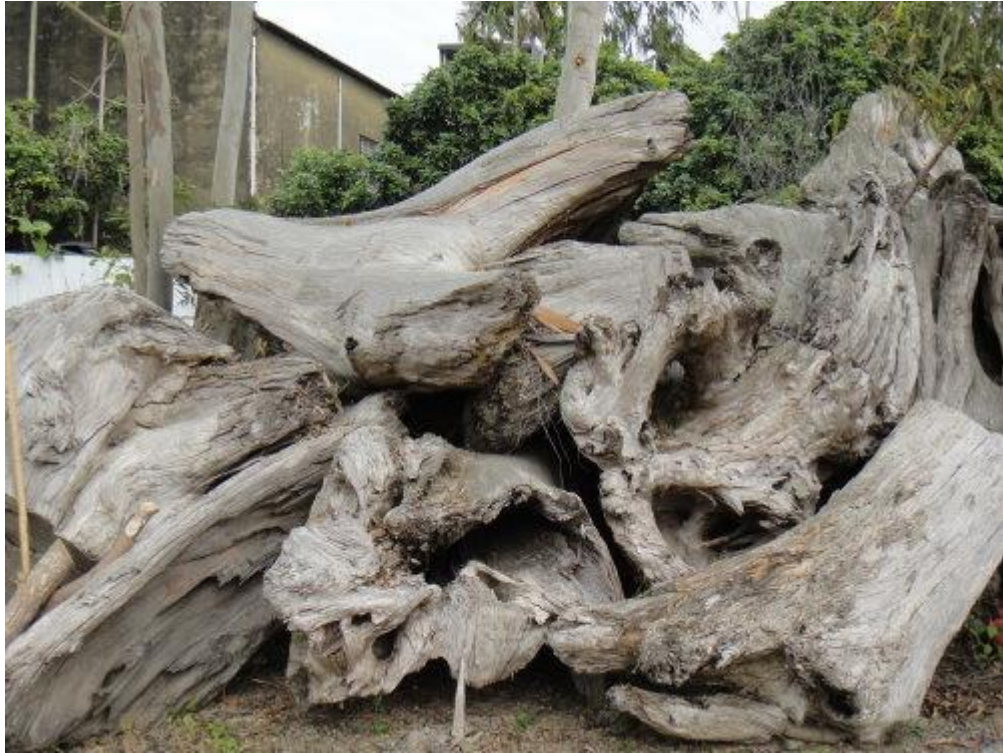
珍藏庫存多年的肖楠木原木, 都是木根部等。